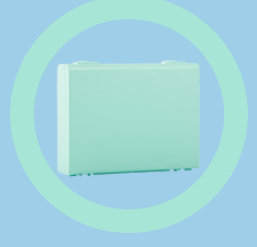
Vert Pastel 011